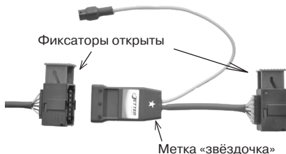
Рис. 1 Внешний вид джеттера.